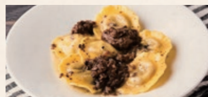
ポルチーニのラヴィオリ トリュフと和牛のラグー 1780 Truffle Ravioli with Wagyu Ragout sauce