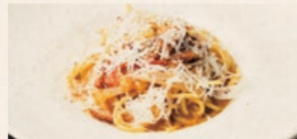
淡路産トマトと玉ねぎの アマトリチャーナ 1680 AWAJI-SHIMA Tomato & Onion Amatriciana