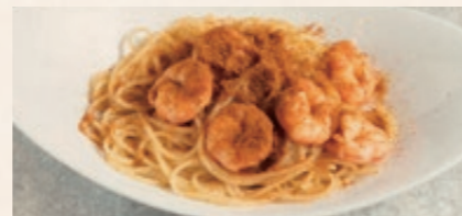
天然海老とカラスミの オイルバスタ 1780 Oil Pasta with Shrimp and Karasumi