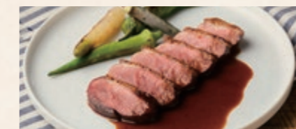
鴨のロースト 山椒とマデラ酒のソース 3200 Roasted Duck with Madera Sauce