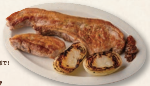
兵庫県産しらさぎ牛 T- BONEステーキ Domestic beef 'SHIRASAGI GYU'

ご注文は 1kg / ¥12,500から、承ります。 詳しくはスタッフまで! Orders start from 1kg (¥12,500)