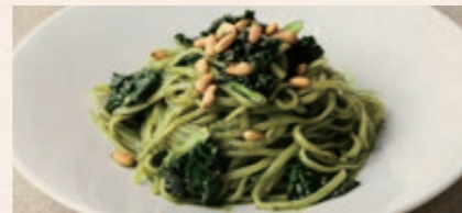
淡路産バジルのジェノベーゼ 1780 Awaji Basil Genovese