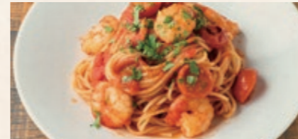
天然海老とトマトのバスタ 1680 Tomato Pastawith Shrimp