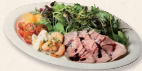
FBC サラダ French Baguette Cafe Salad ローストビーフ、淡路島チーズのモッツアレラ、 小エビのソテーなどボリュームたっぷり贅沢サラダ