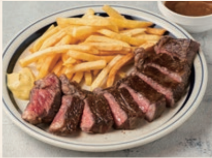
アンガスビーフ ステーキランチ