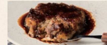
アッシュパルマンティエ 2200 〈和牛の赤ワイン煮込みと ジャガイモとマッシュルームのグラタン〉 Acetes Parmentier