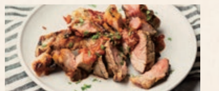
群馬県産 優味豚 スペアリブのBBQ 2400 GUNMA Local Pork Spareribs