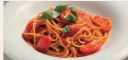
淡路産トマトとバジルの ポモドーロ 1280 Awaji Local Tomato & Basil Pomodoro