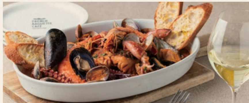
ズッパ・ディ・ペッシェ 4300 Zuppa Di Pesce たっぷりの魚介をトマトと白ワインで煮込むナポリの漁師料理。