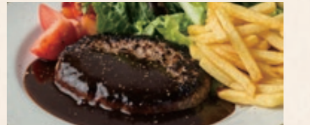
淡路牛ハンバーグ 焦がしハチミツの赤ワイン デミグラスソース 1700 Hamburger Steak Demiglace Saucer チーズトッピング+100 / 目玉焼きトッピング+100