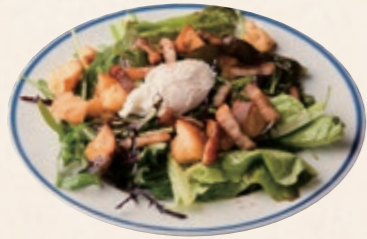
リヨネーズサラダ Lyonnais Salad ベーコン、バターズの染み込んだバゲットと ポーチドエッグのサラダ