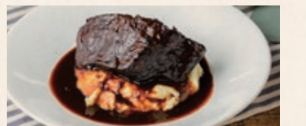
淡路牛の赤ワイン煮込み 2500 Wagyu shank stewed in red wine