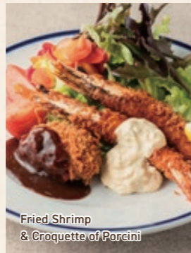
Fried Shrimp & Croquette of Porcini