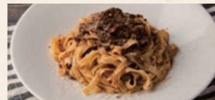
和牛のボロネーゼタリアテッレ 1780 WAGYU Beef Bolognese Tagliatelle