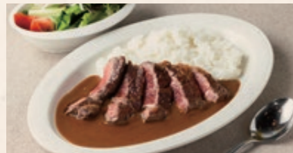
アンガスビーフステーキカレー Beef Steak Curry 150g / 2000 200g / 2500 250g / 3000