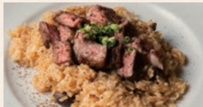
黒毛和牛ステーキと 淡路玉ねぎのピラフ 2200 Wagyu Beef Steak and Awaji Onion Pilaf やわらかくジューシーな黒毛和牛ステーキ。 国産の大麦も入って、食感と風味豊かな一品。