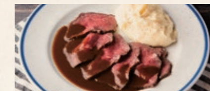
黒毛和牛 ローストビーフ 100g / 2600 グレイビーソース Roast Beef with Gravy sauce