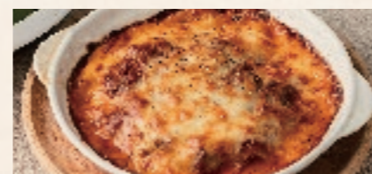
淡路牛ボロネーゼのラザニア 1600 Awaji Beef Bolognese Lasagna Lunch