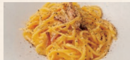
パンチェッタと淡路麺業'EGG' 生パスタのカルボナーラ 1680 AWAJI-SHIMA Local Egg Carbonara