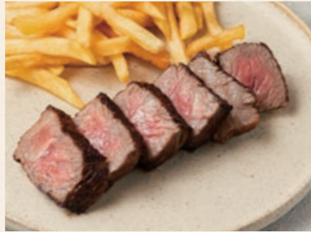
和牛ステーキランチ 150g