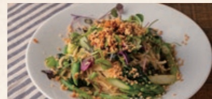
お野菜と胡麻のアーリオオーリオ 1680 Aglio Aglio with vegetables and sesame seeds