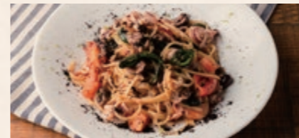
淡路産 ヒイカとオリーブのバスタ 1780 Pasta with AWAJI Hiyka and Olives